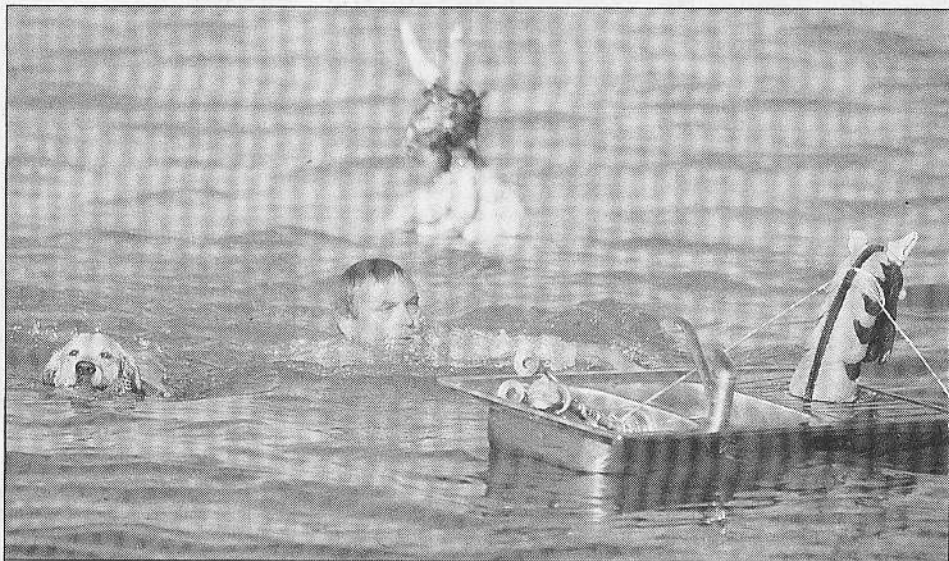
Une expérience artistique annuelle sur la plage du Fort-Carré avec des artistes surprenant qui n'hésitent pas à se jeter à l'eau.